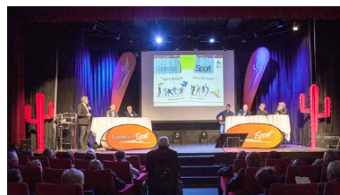
Salle des Congrès