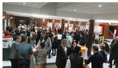
Le Village entreprise, un espace de convivialité.